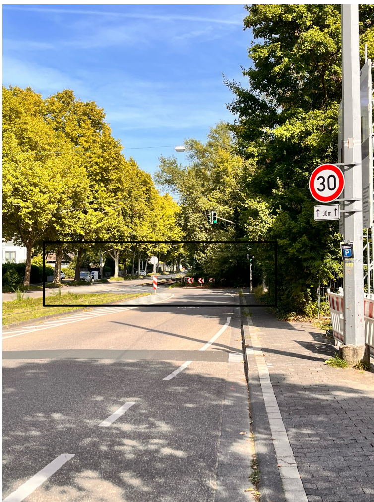
Abbildung 3: fotografiert von der Einfahrt zur Kita bergab in Richtung Innenstadt, schwarz markiert die verschwenkte Fahrbahn und die Ampelanlage (ohne Fußgängerampel)