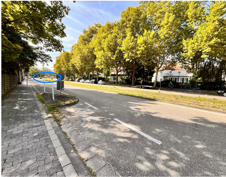
Abbildung 2: fotografiert von der Einfahrt zur Kita bergan in Richtung Ortskern, blau markiert die Straßenbahnhaltestelle mit Zebrastreifen